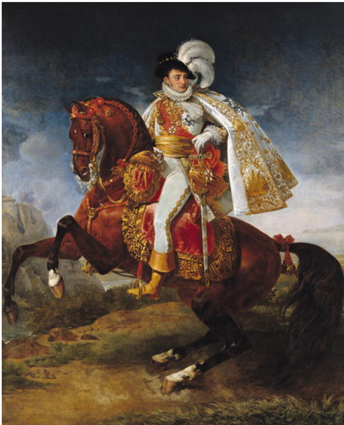
Portrait équestre du roi Jérôme Bonaparte, roi de Westphalie, par Antoine-Jean GROS (1771-1835)