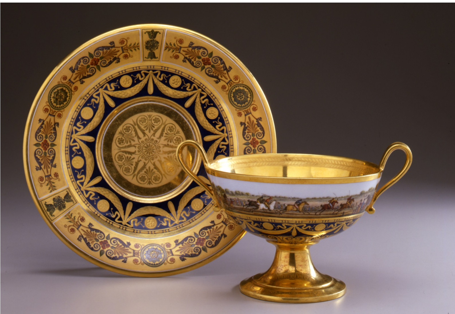
III. 3 Manufacture de Sèvres, coupe « à bouillon hémisphérique » décorée d'une course hippique au Champs de Mars offerte en présent du Nouvel An 1812 à la comtesse de Montalivet, dame d'honneur de l'impératrice Marie-Louise, 1811. Musée Napoléon Ier, château de Fontainebleau.