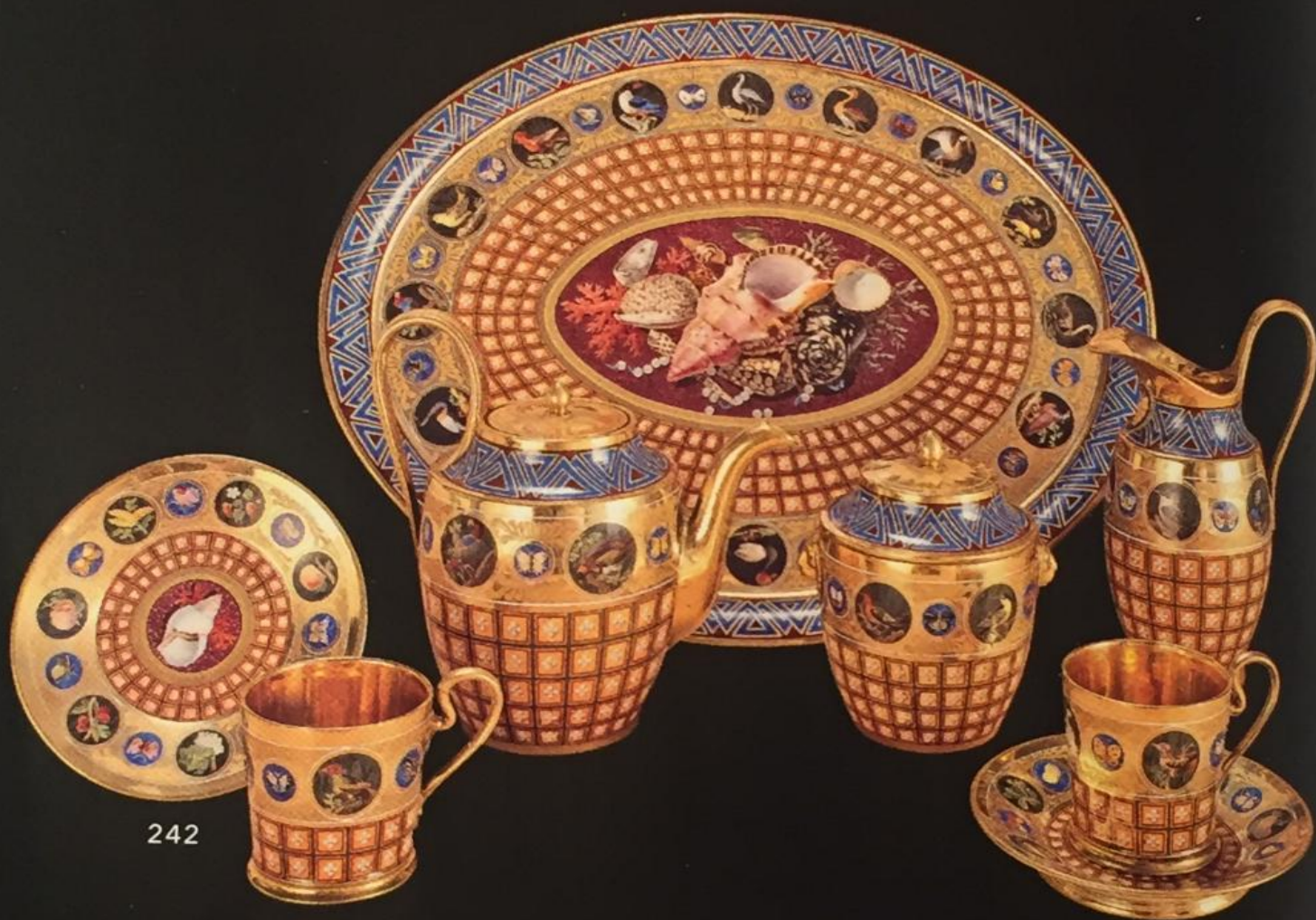
III. 2 Manufacture de Sèvres, 1812, Service à thé imitation de mosaïques, offert à la comtesse de Montesquiou pour les étrennes de 1813 Cooper Hewit museum